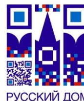
Россотрудничество (Русский Дом)