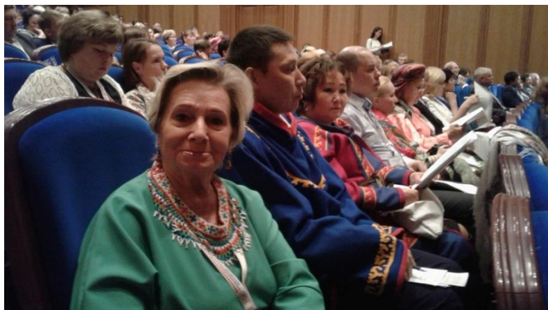
Очередной съезд коренных малочисленных народов Севера в Москве.