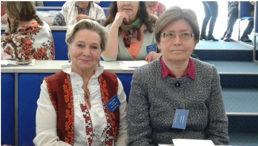
На Международной научно-практической конференции с венгерской ученой Мартой Чепраги, ЮГУ, 2017 г.