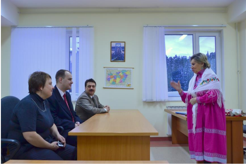
Члены Правительства ХМАО-Югры посетили кабинет венгерского языка в ЮГУ, 2011 г.