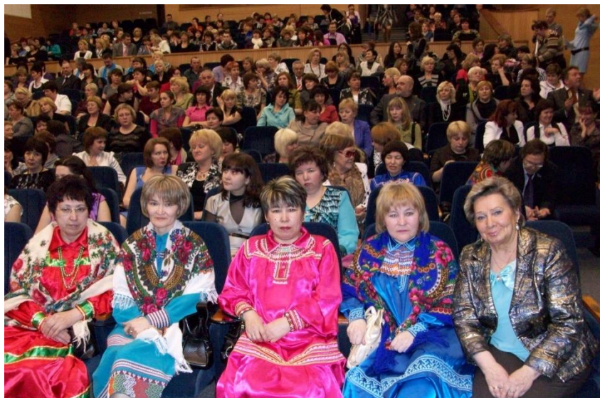
На подведении итогов конкурса «Учитель года», Ханты-Мансийск, 2014 г.