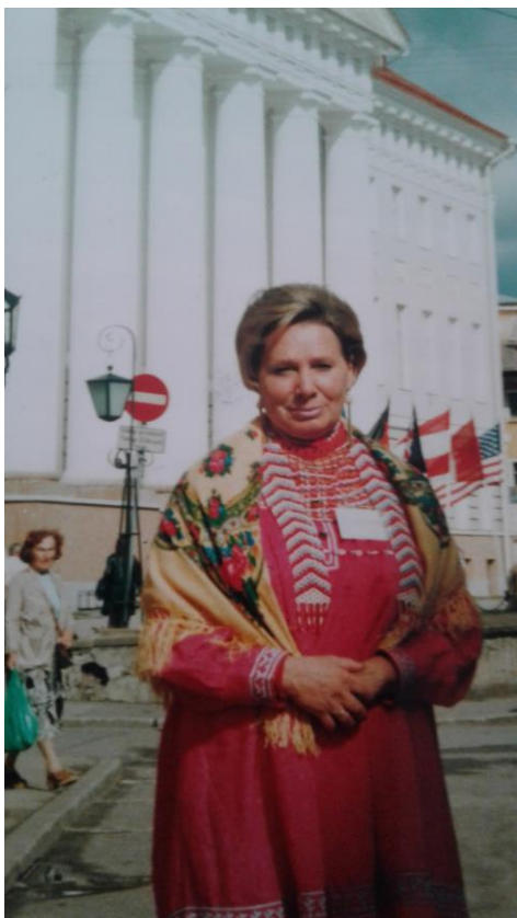
Международный Финно-угорский Конгресс, г.Тарту, Эстония,2010 г.