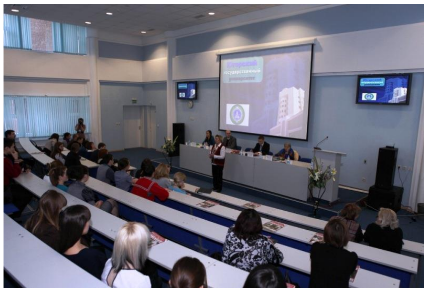
Международная конференция в ЮГУ, 2018 г.