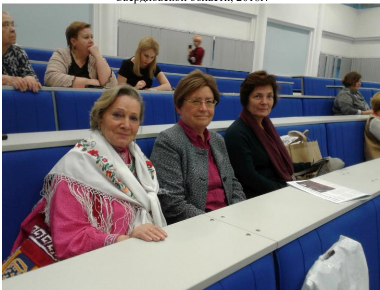
Международная научно-практическая конференция «Бахлыковские чтения». Присутствует делегация из Венгрии. ЮГУ, 2017 г.