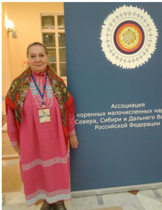
Второй съезд учителей родного языка. Санкт-Петербург, 2019 г.