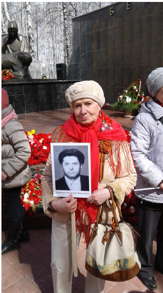
«Бессмертный полк», Ханты-Мансийск, 9 мая 2017 г.