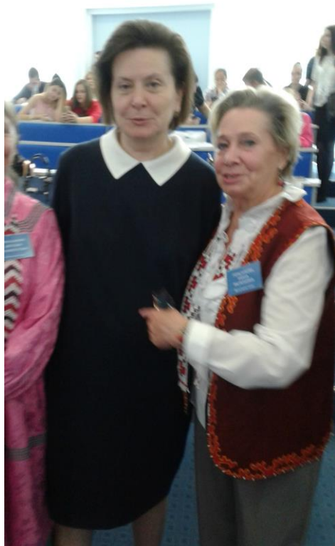
Губернатор Югры Комарова Н.В. посетила заседание МАФУН в ЮГУ 2013 г.