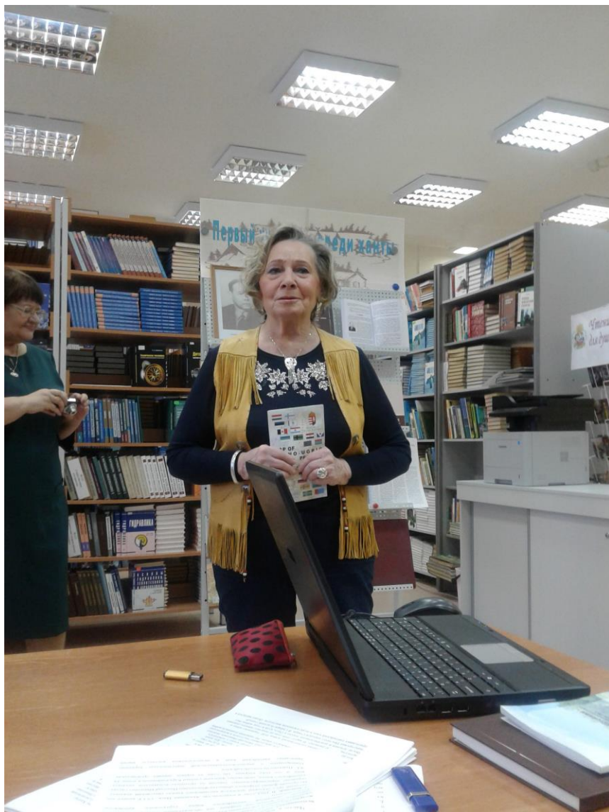
Встреча с учащимися технолого-педагогического колледжа. Ханты-Мансийск, 2018 г.