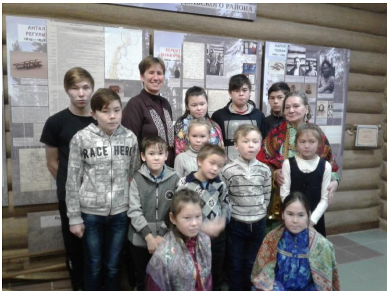
Открытие выставки «По следам А. Регули». Музей г. Ивдель, Свердловской области, 2018г.