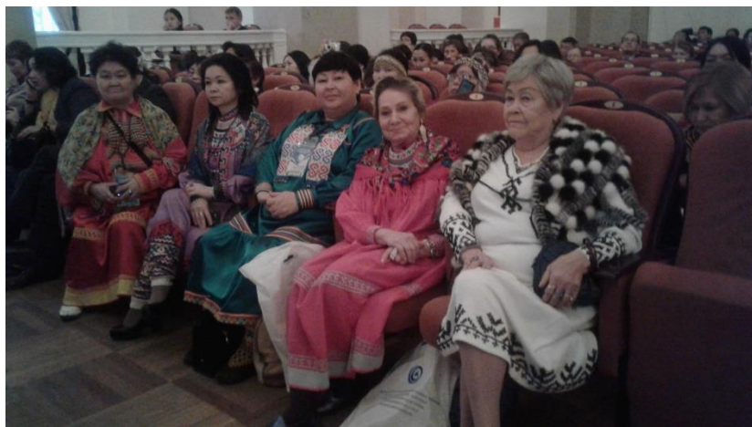
Подведение итогов конкурса «Учитель родного языка», 2017 г.