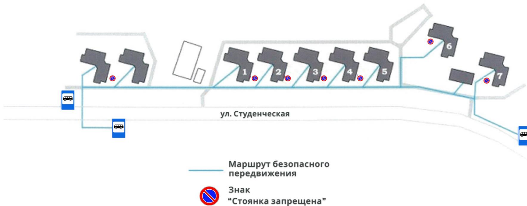
СХЕМА РАСПОЛОЖЕНИЯ ОБЩЕЖИТИЙ И БЛИЖАЙШИХ ОСТАНОВОК